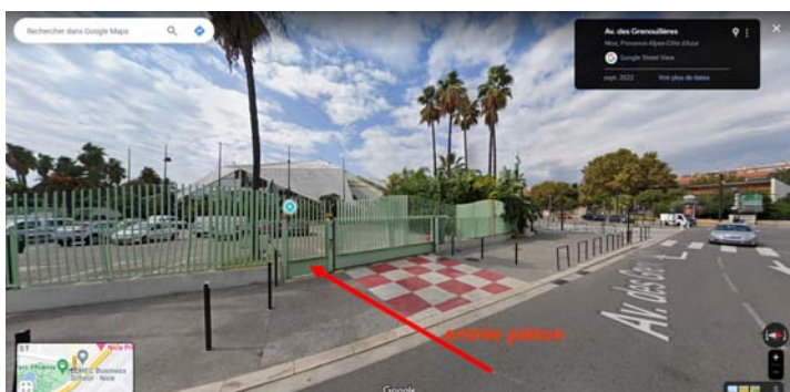
entrée du Parc face à l'EDHEC)